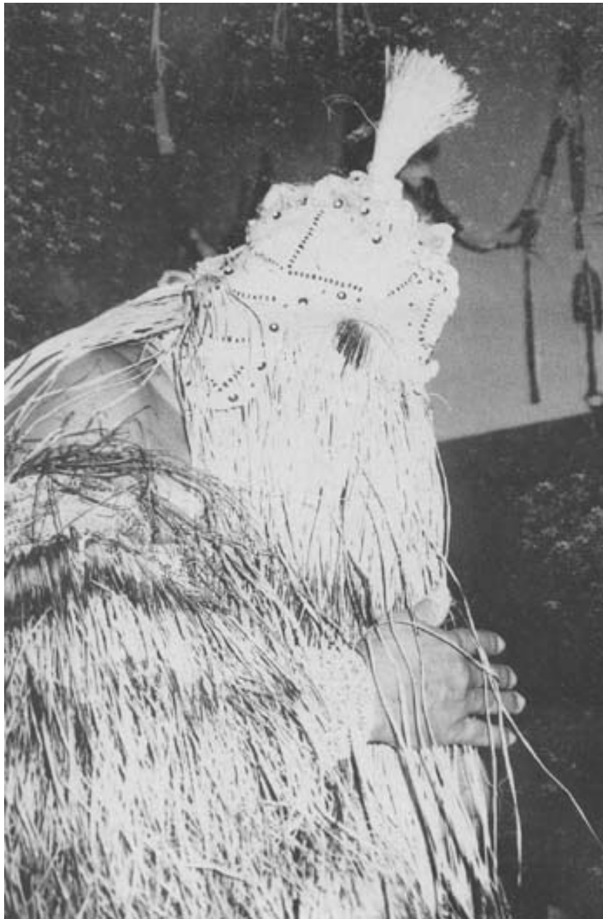
Obaluaiê ou Omulu, sempre coberto de palha, é o orixá da variola, da peste, e hoje em dia da Aids.