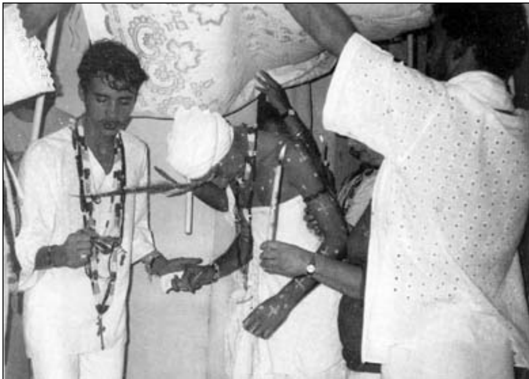
Saída de iniciação segundo o rito da Casa das Minas de Thoya Jarina.