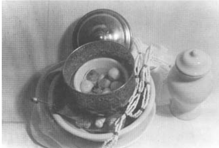
Assentamento de Oxalá jovem, Oxaguiã, deus da Criação e inventor da cultura material. A cor de Oxalá é sempre o branco ou prata e chumbo. É o orixá mais homenageado do panteão.