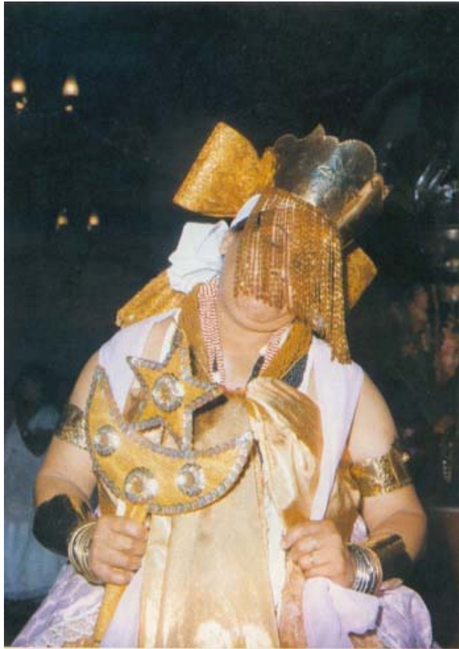
Oxum, divindade do ouro e do amor, paramentada em dia de festa no Aché Ilê Obá, terreiro hoje dirigido por Mãe Sílvia de Oxalá.