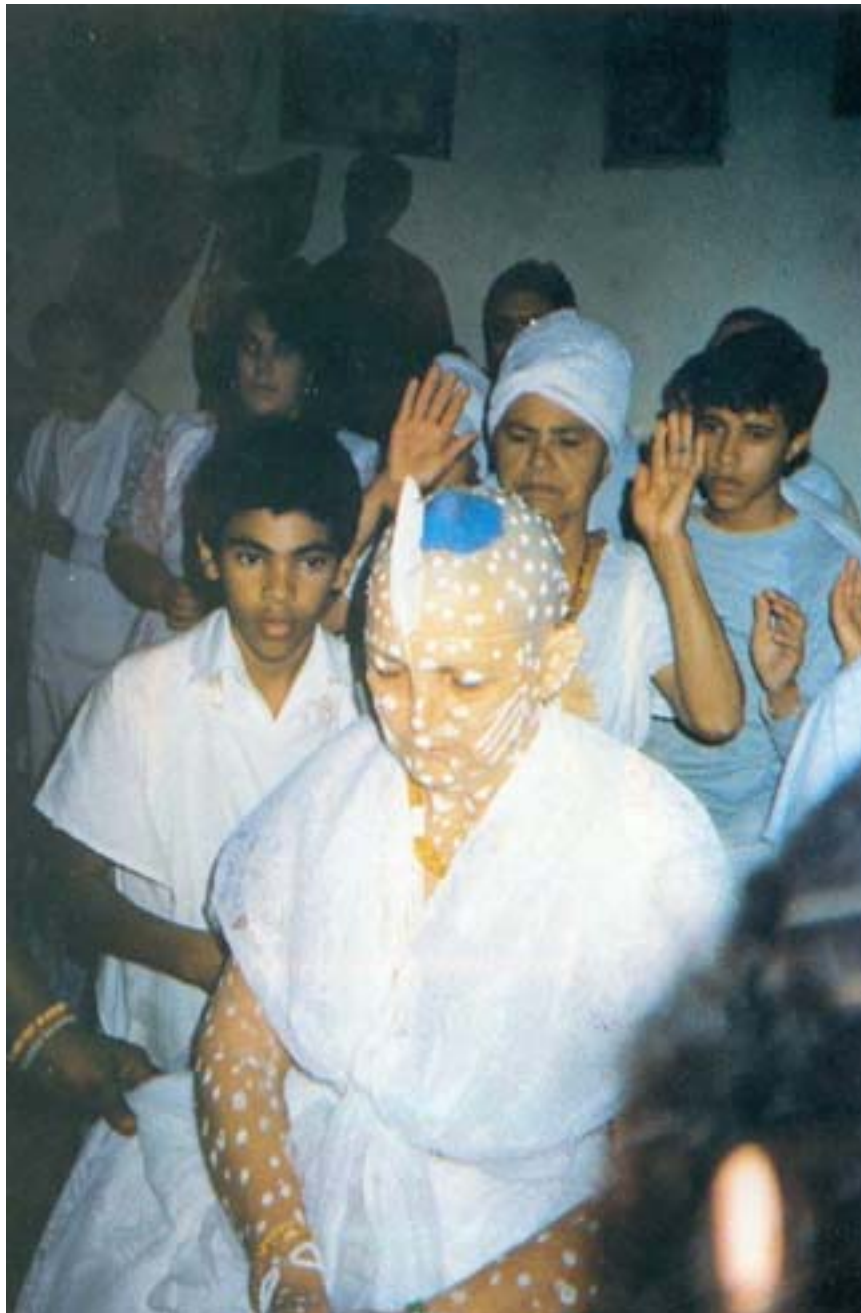
A filha-de-santo recém-iniciada é apresentada ao público na saída de iaô, no candomblé de Mãe Zefinha da Oxum.