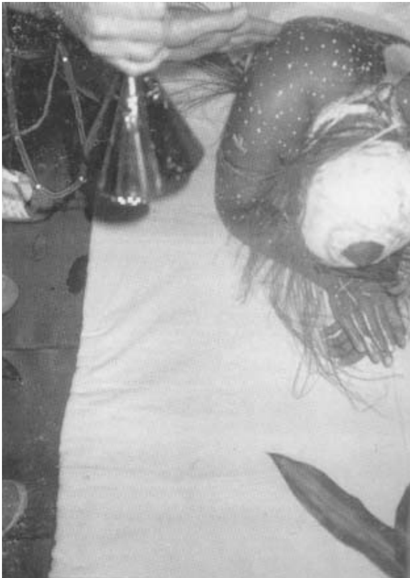
Na cerimônia de iniciação, o iaô, raspado e pintado, deitado de bruços, saúda com palmas ritmadas o chão sagrado do terreiro. Candomblé queto de Pai Armando de Ogum.