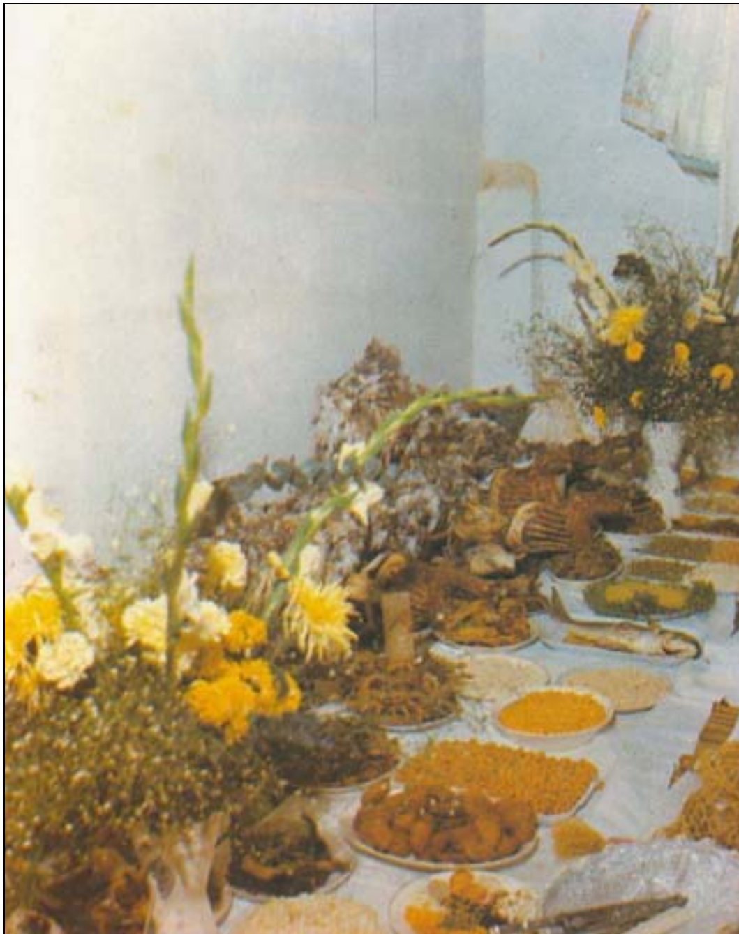
O quarto-de-santo em período de obrigação, repleto de oferendas aos orixás: comidas, flores, objetos rituais.