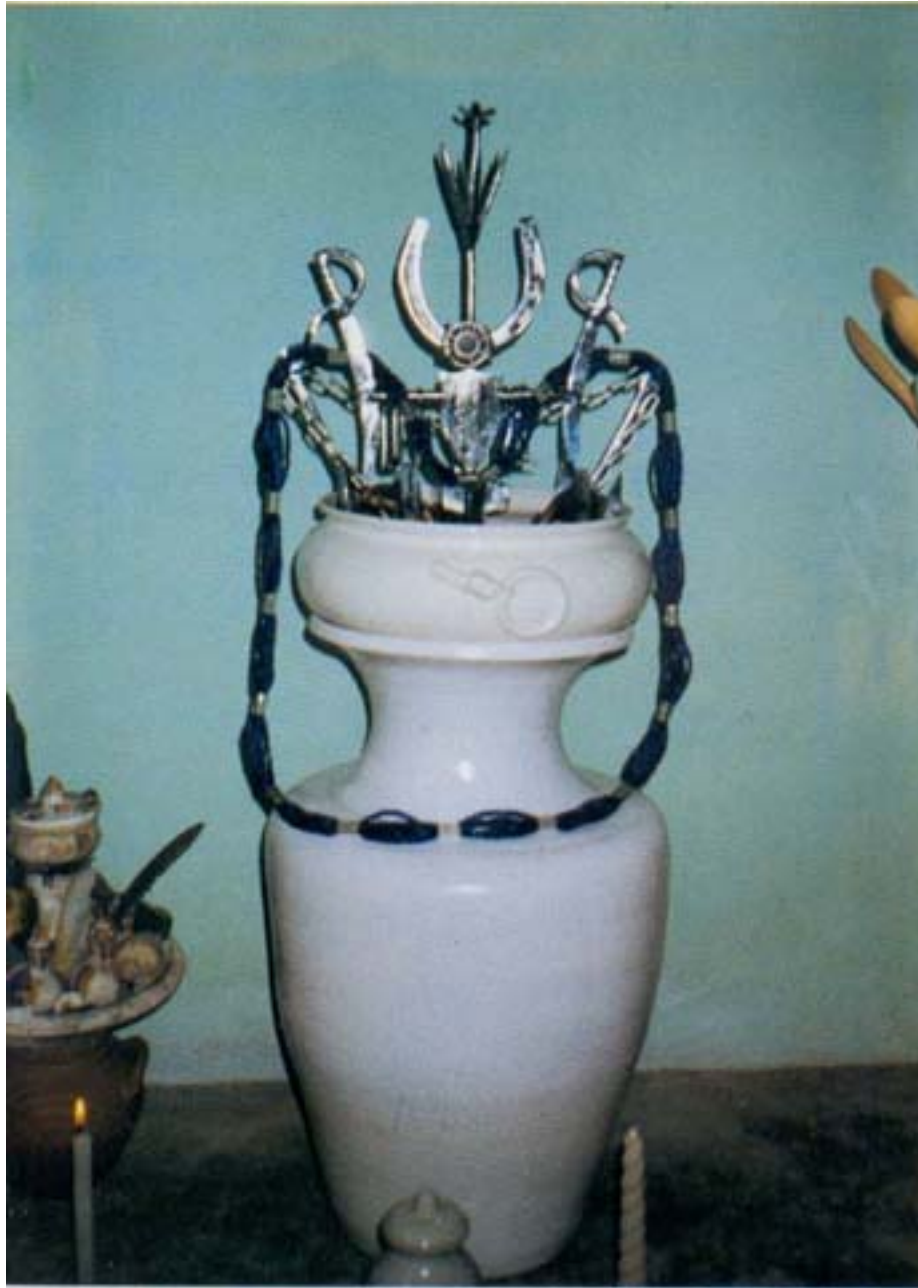
Assentamento do orixá Ogum com os símbolos materiais da divindade. Cada iniciado tem seu “santo” assentado e é junto ao assentamento que os sacrifícios são oferecidos. Candomblé angola de Pai Wilson de Iemanjá.