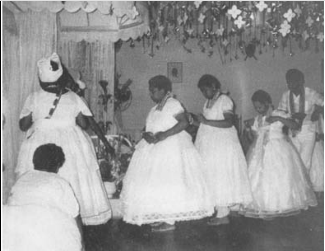
Um barco de iaôs (iniciados na mesma época) na roda-de-santo do Aché Ilê Obá, o terreiro tombado pelo Condephaat.